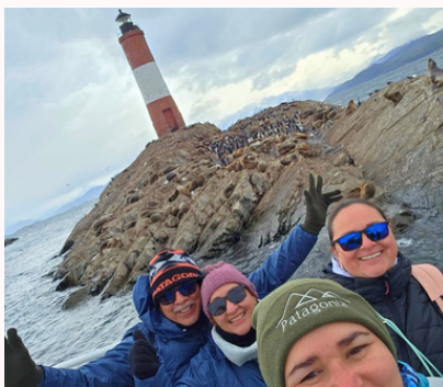
Faro Fin del Mundo