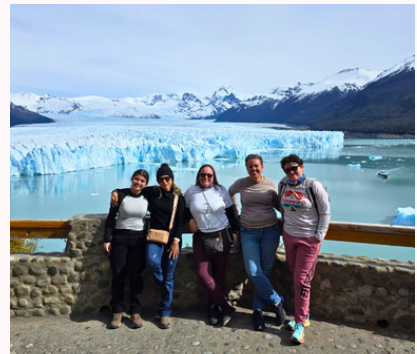
Glaciar Perito Moreno