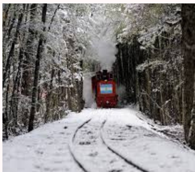
Tren Fin del Mundo