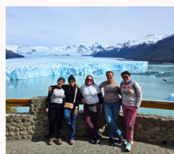
Glaciar Perito Moreno