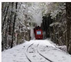
Tren Fin del Mundo