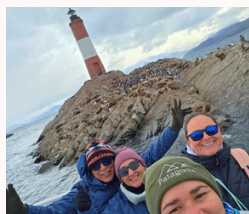
Faro Fin del Mundo