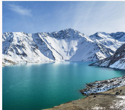
Embalse El Yeso